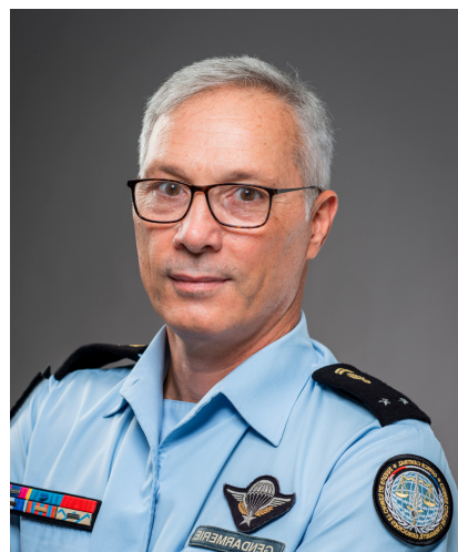
Général Jean-Philippe Reiland

Experte en modération des contenus en ligne, circulation de l'information, Web3, Internet gouvernance